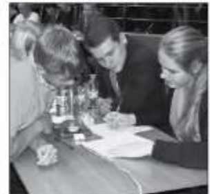
Победители конкурса, школа №2.

Группа по связям с общественностью и СМИ, филиал ОАО «ОГК-2» - Киришская ГРЭС.