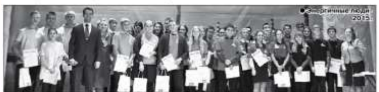
«Энергичные люди» 2015.